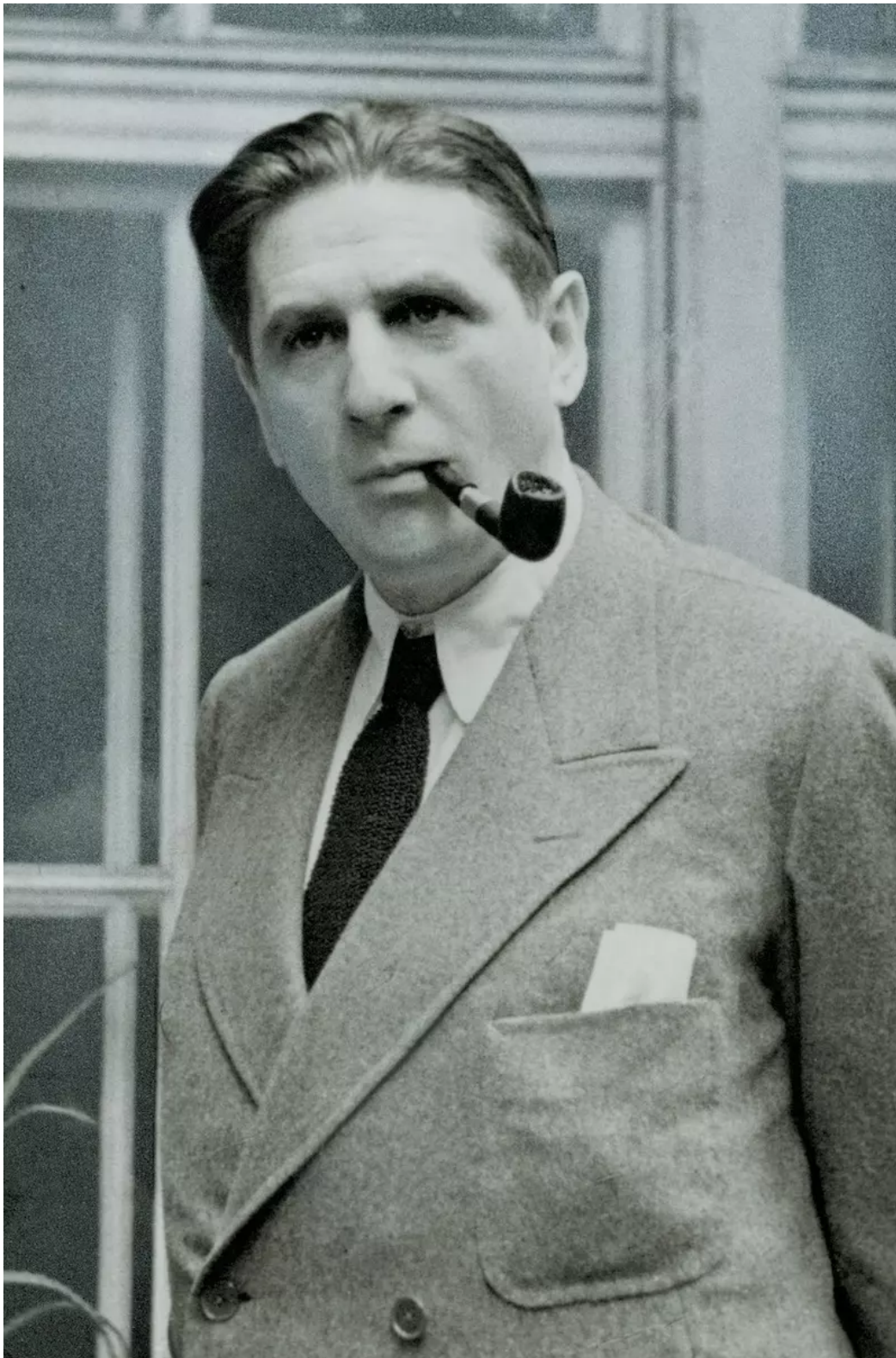
Hermann Broch v roce 1935